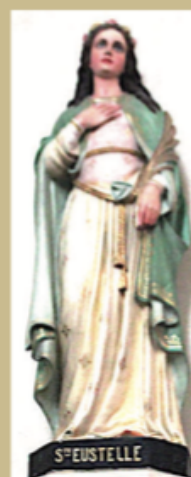
S TE EUSTELLE

On retrouve beaucoup d'illustrations, de vitraux, à la gloire de cette jeune martyre dans toutes nos églises de Saintonge. Le prénom d'Eustelle ou Estelle fut tellement populaire en Charente que les évêques de Saintes et de La Rochelle la proposèrent comme sainte patronne de la jeunesse.