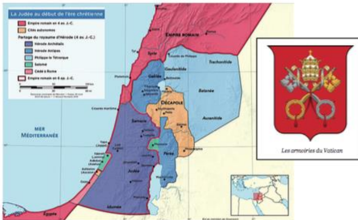
Carte de la Judée au début de l'ère chrétienne

Pierre demande sa crucifixion la tête en bas car il se sent indigne de mourir de la même manière que Jésus-Christ.