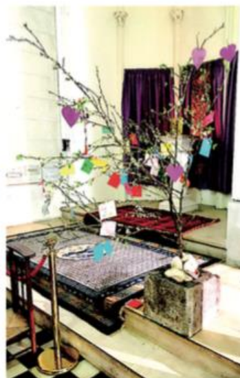
En l'église de Montendre, l'arbre de vie et ses messages d'espérance écrits et dessinés par les enfants du catéchisme

Père Julien Bergson : 07 57 42 28 16 - bj25jb@gmail.com