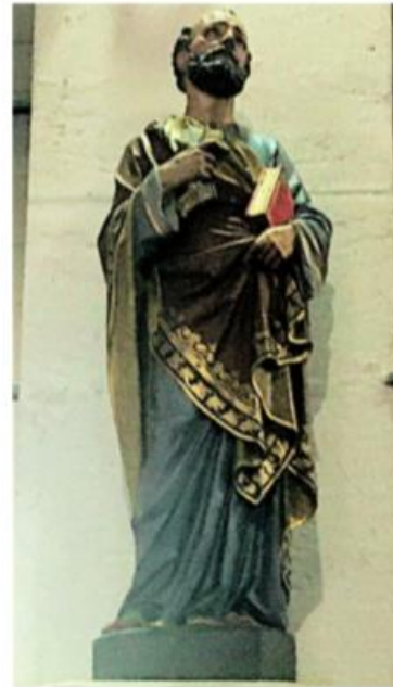
Saint-Pierre, premier Pape des chrétiens

Après la Passion, la crucifixion et la mort de Jésus-Christ, c'est Pierre qui entre le premier dans le tombeau et le trouve vide.