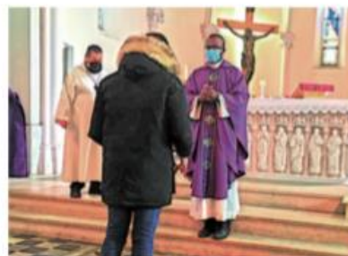
Durant la messe, ont été déposés des objets qui symbolisent l'entraide aux pays du Sud : un globe (le monde), du tissu (fabrication), de l'huile d'olive (production) et un morceau de métal (minerais).

Pour eux tous, infiniment merci à chacune et chacun d'entre vous .