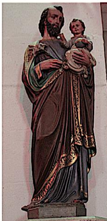
Saint-Christophe est considéré comme le patron des voyageurs.

- « Ne t'étonne pas. Je suis le Christ, le créateur du monde. Pour te prouver que je dis vrai, tu planteras ton bâton quand tu seras retourné sur l'autre rive. Demain, tu y verras des feuilles et des dattes. Désormais, tu l'appelleras Christophe ». Puis l'enfant disparut.