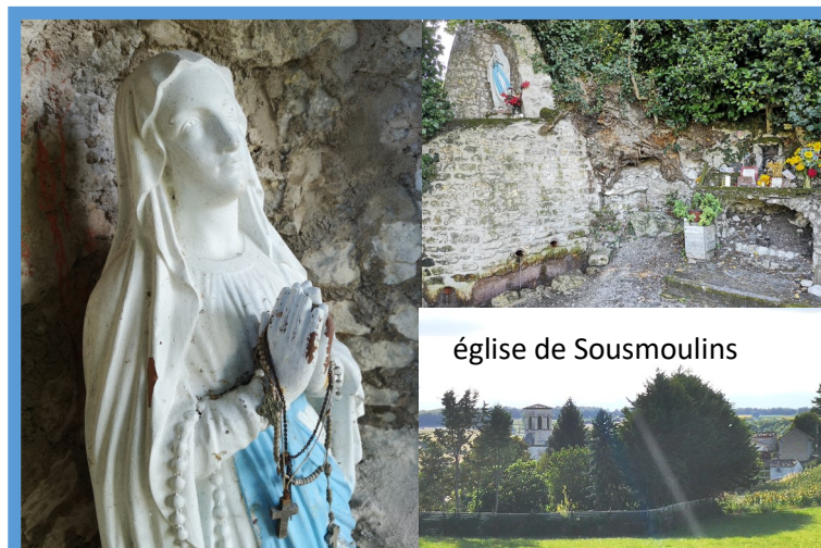
église de Sousmoulins

Le 15 août messe à 10h30 église de Sousmoulins et procession en suivant à la Vierge de « Pipou »