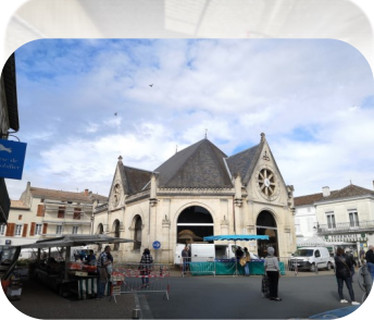
Marché de la tentation