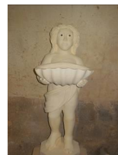
détail du bénitier

L'Eglise de Rouffignac est magnifique. Son clocher fait penser à l'édicule de l'église monolithe d'Aubeterre