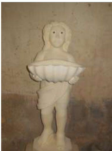
benitier eglise de rouffignac