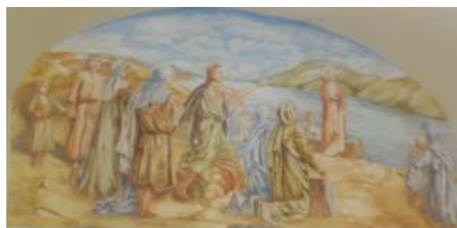
fréscue : eglise de chartrazac