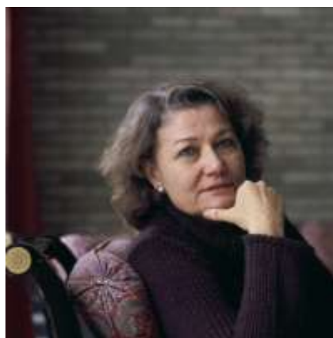
Pasteure à Genève. Docteur en théologie.

Mercredi 6 mai 20h30 salle Jean Monnet (À côté de la médiathèque)